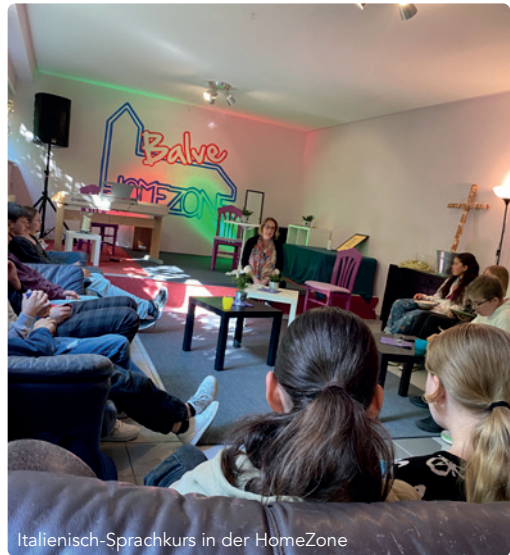
Italienisch-Sprachkurs in der HomeZone