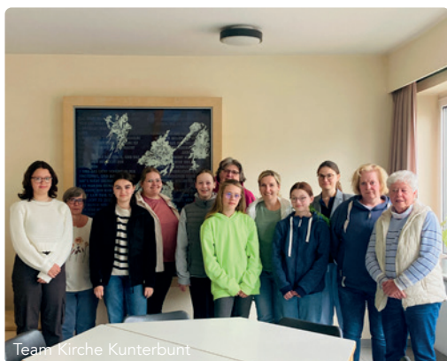
Team Kirche Kunterbunt