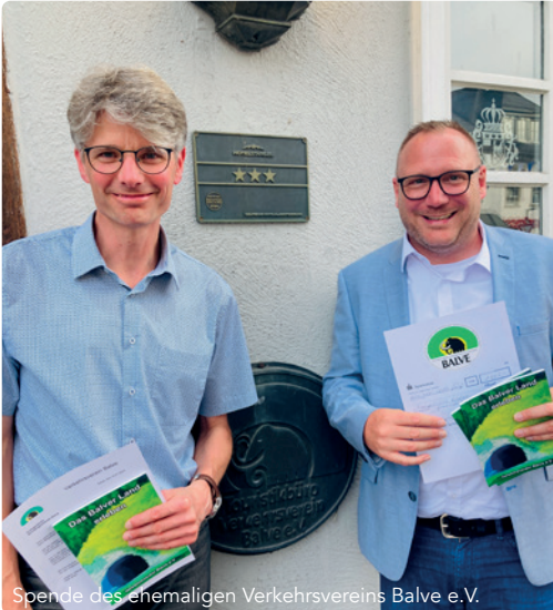
Spende des ehemaligen Verkehrsvereins Balve e.V.