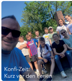
Konfi-Zeit: Kurz vor den Ferien