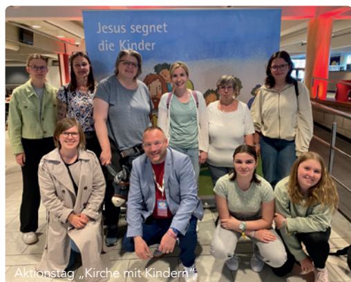
Aktionstag „Kirche mit Kindern“