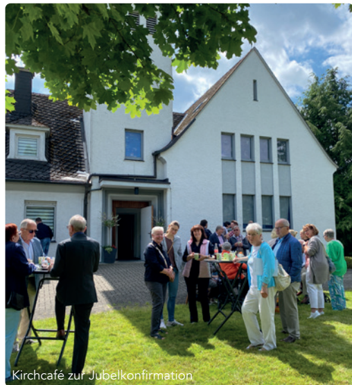
Kirchcafé zur Jubelkonfirmation