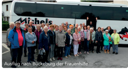
Ausflug nach Bückeburg der Frauenhilfe