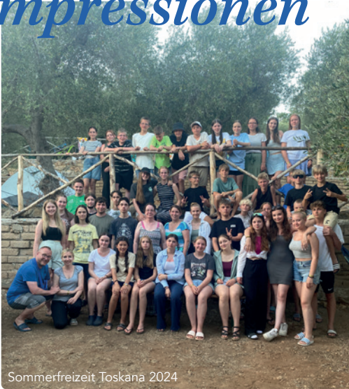
Sommerfreizeit Toskana 2024