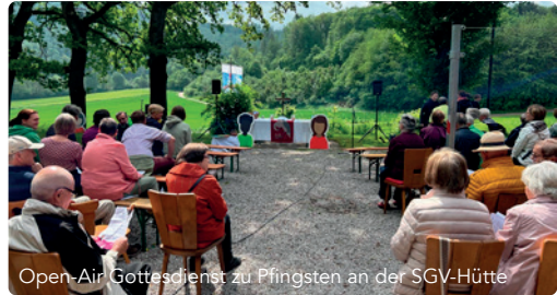
Open-Air Gottesdienst zu Pfingsten an der SGV-Hütte