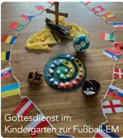
Gottesdienst im Kindergarten zur Fußball-EM